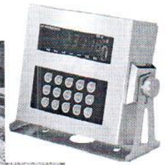
Рисунок 1 - Внешний вид весов вагонных электронных ВВЭС

Схема пломбирования весов от несанкционированного доступа с указанием мест нанесения знака поверки в виде клейма-наклейки и оттиска знака поверки приведена в Приложении А.