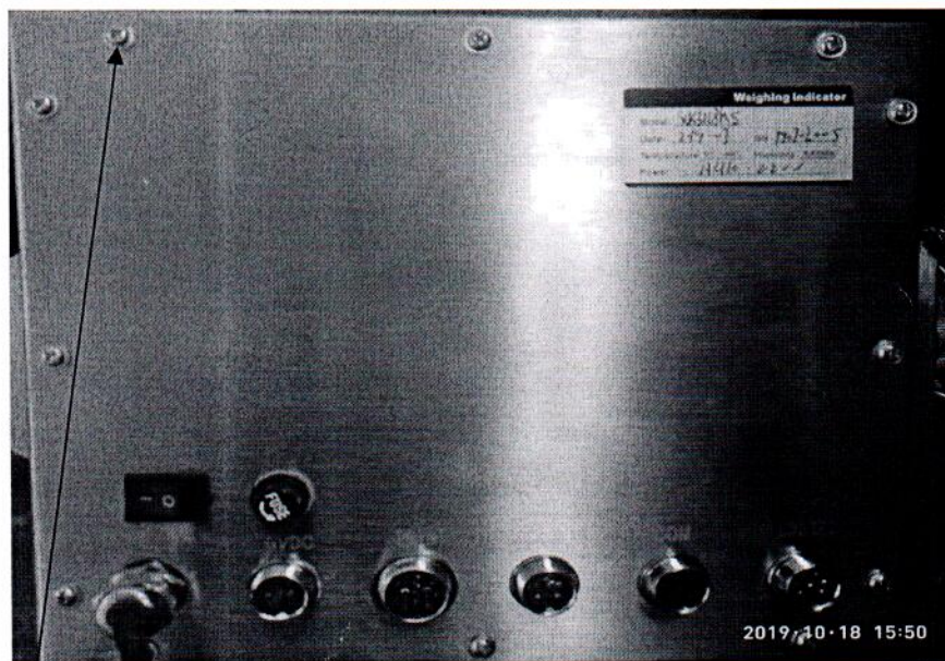
Место пломбирования и нанесения знака поверки (винт доступа к кнопке входа в режим калибровки)