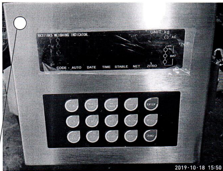
Место нанесения знака поверки в виде клейма-наклейки