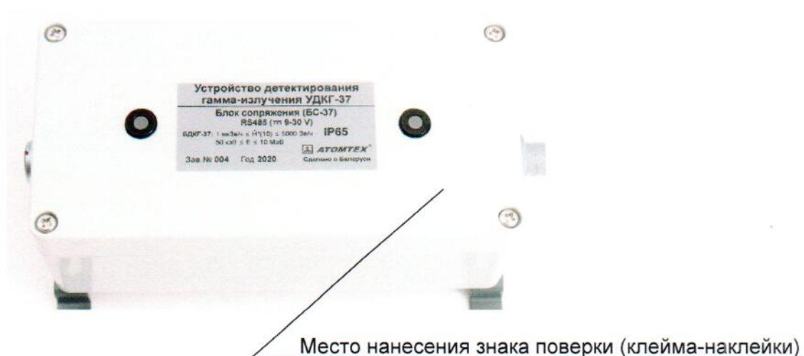
Рисунок 2 – Место нанесения знака поверки (клейма-наклейки)

Место нанесения знака поверки (клейма-наклейки) приведено на рисунке 2.