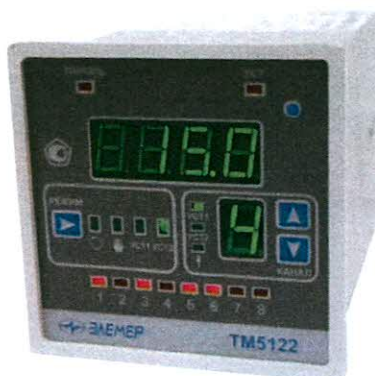
TM 5122 (TM 5122A, TM 5122Ex, TM 5122P) Рис. 1