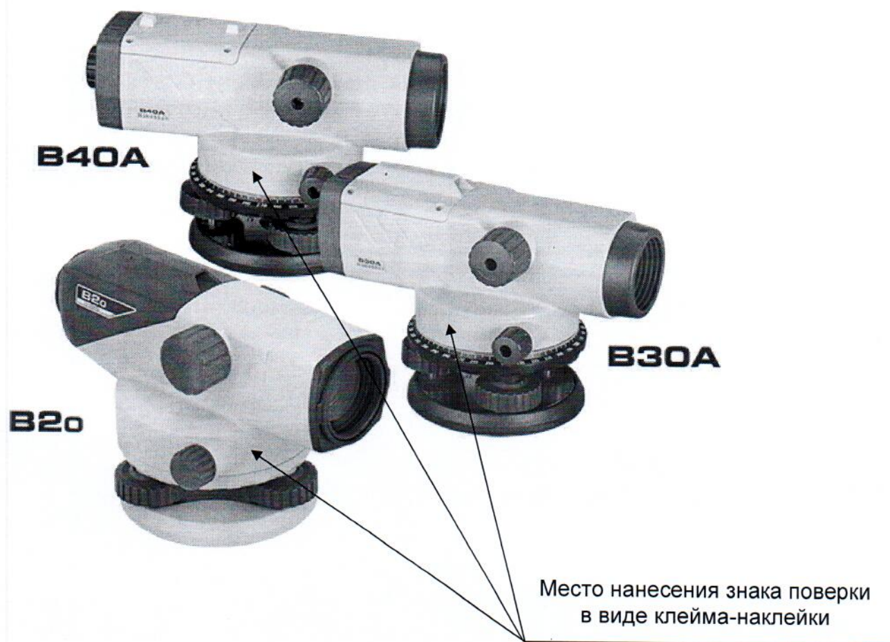
Рисунок А.1 – Место нанесения знака поверки в виде клейма-наклейки