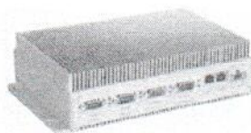
RTU-327L и RTU-327LV