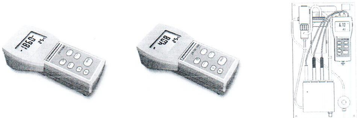
Рис.1. Фотография внешнего вида pH-метров pH-150МИ и иономеров модификаций рХ-150МИ, рХ-150.1МИ и рХ-150.2МИ.

рХ-150.2МИ - предназначен для измерения рХ и массовой концентрации (сХ) ионов натрия, а также pH и t в химически обессоленной воде и конденсате пара котлов высокого давления и турбин, а так же для использования в системах химического контроля за состоянием H + -катионитовых фильтров.