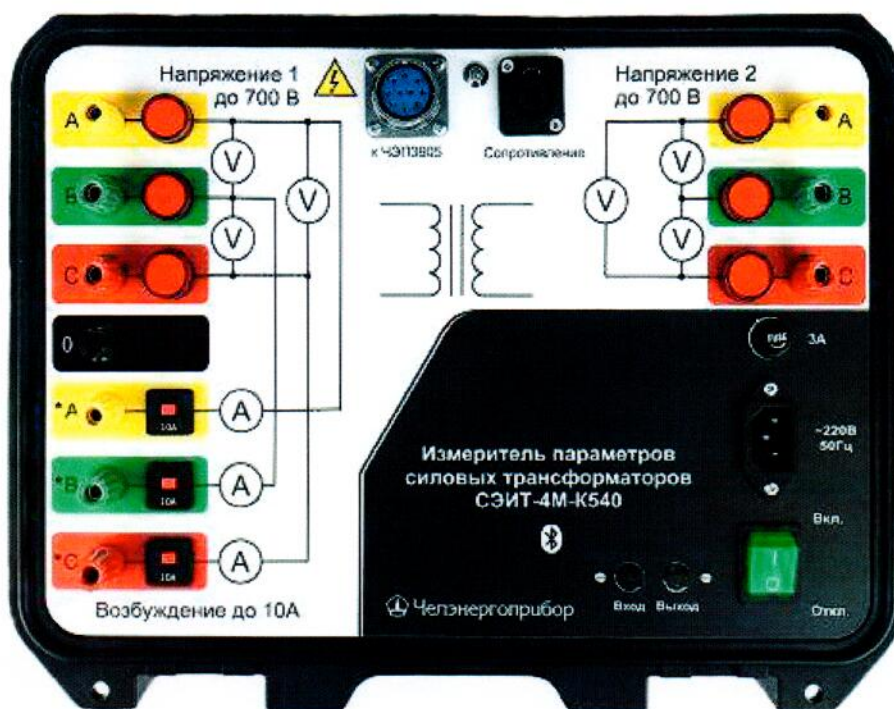
Рисунок 2- Внешний вид ИВБ измерителя СЭИТ-4М-K540 (исполнение 2)