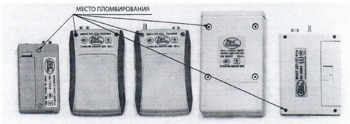
Рисунок 3 - место пломбирования мониторов Комплекта КМкн-«Союз-«ДМС»

Результаты поверки СИ удостоверяются знаком поверки, который наносится на Свидетельство о поверке.