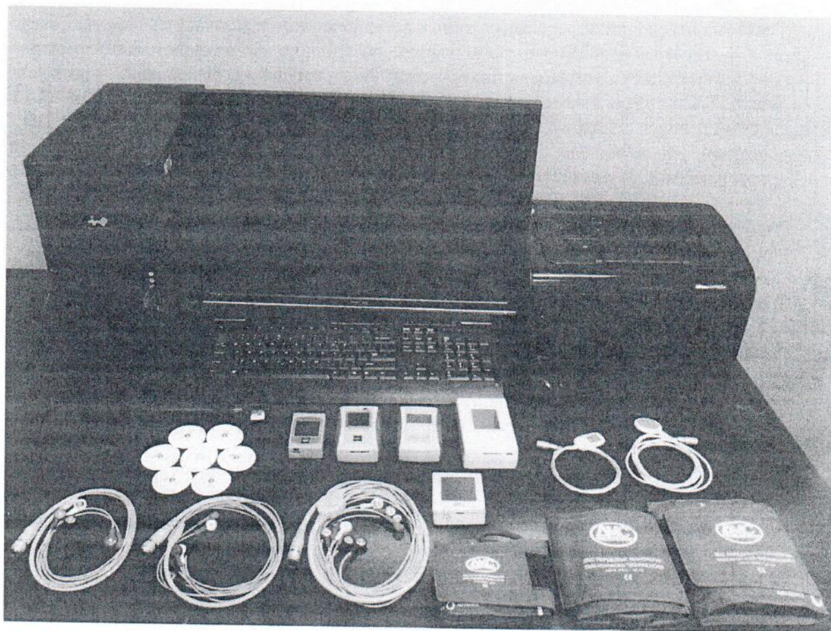
Рисунок 1 - Общий вид Комплекта КМкн-«Союз-«ДМС» с принадлежностями и расходными материалами

Общий вид Комплекта мониторов компьютеризированных носимых одно, двух, трехсуточного мониторинга ЭКГ, АД, ЧП КМкн-«Союз-«ДМС» с основными принадлежностями, место нанесения на мониторы знака утверждения типа и место пломбирования мониторов показано на Рисунках 1, 2, 3 соответственно.