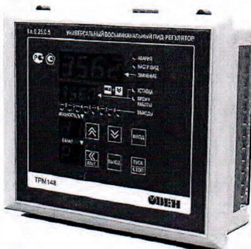
Рис.2 - Общий вид приборов в исполнении Щ7