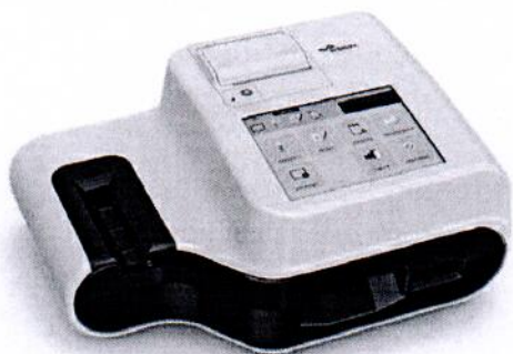
Анализатор мочи UC-1000

Внешний вид анализаторов мочи серии UC показан на рисунке 1.