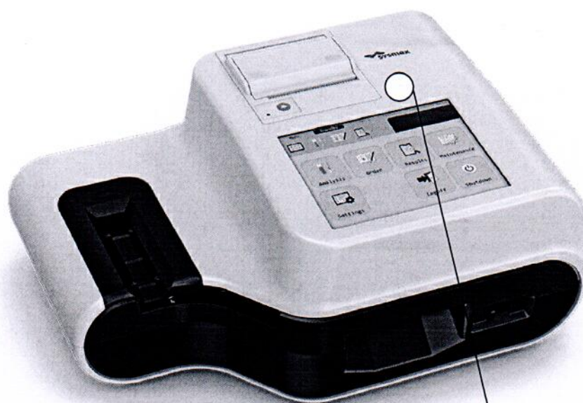
Схема с указанием места нанесения знака поверки (клейма-наклейки)

Место нанесения знака поверки (клеймо-налейка)