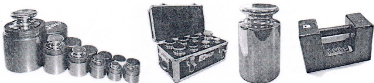
Рисунок 1 – Общий вид гирь

Маркировка гирь соответствует требованиям ГОСТ OIML R 111-1-2009.