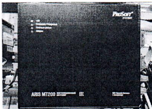
Рисунок 1 – Общий вид контроллеров

Общий вид контроллеров с указанием мест пломбирования от несанкционированного доступа и нанесения знака поверки представлен на рисунках 1-2.