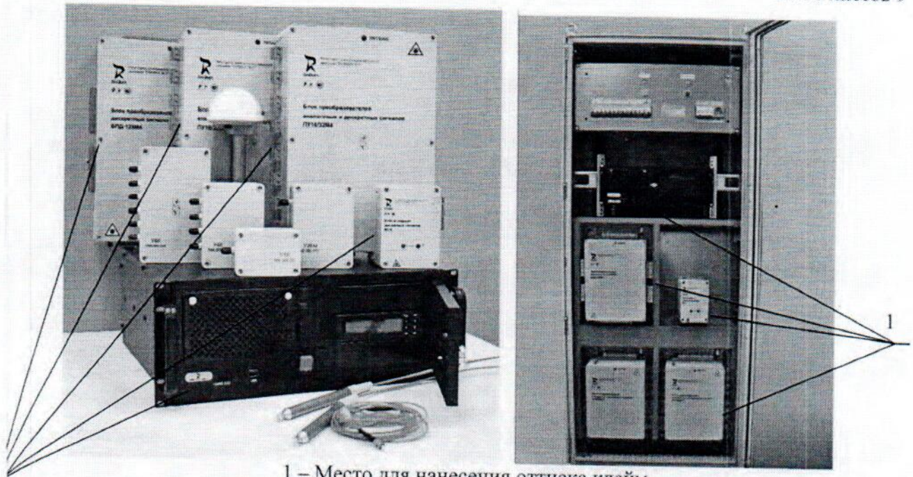
1 – Место для нанесения отиска клейм