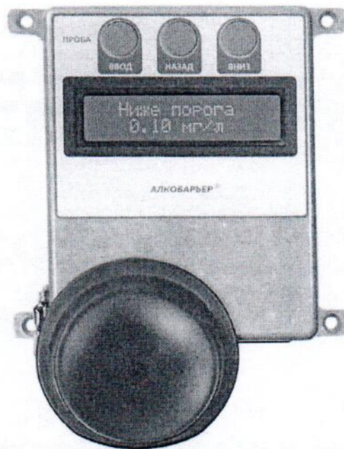
Рисунок 1 – Общий вид газоанализаторов АЛКОБАРЬЕР исполнения АЛКОБАРЬЕР, АЛКОБАРЬЕР-01

Общий вид газоанализаторов представлен на рисунке 1.