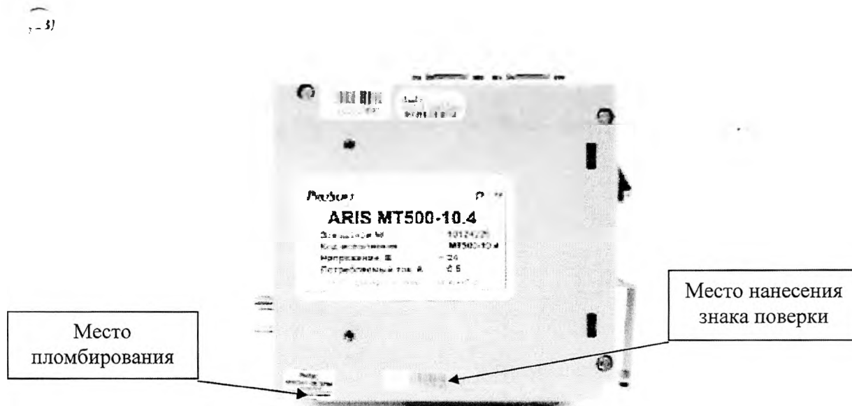
Рисунок 1 – Общий вид контроллеров с указанием мест пломбирования от несанкционированного доступа и нанесения знака поверки