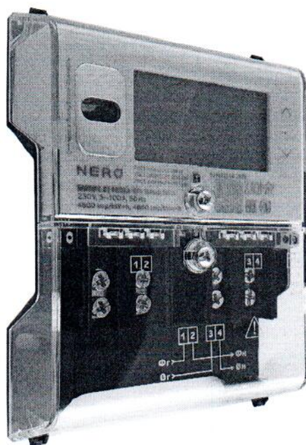
Рисунок 2 – Общий вид счётчика

Фотография общего вида счётчиков приведена на рисунке 2.