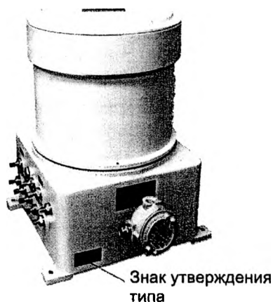
Рисунок 2: Внешний вид блока аналитического