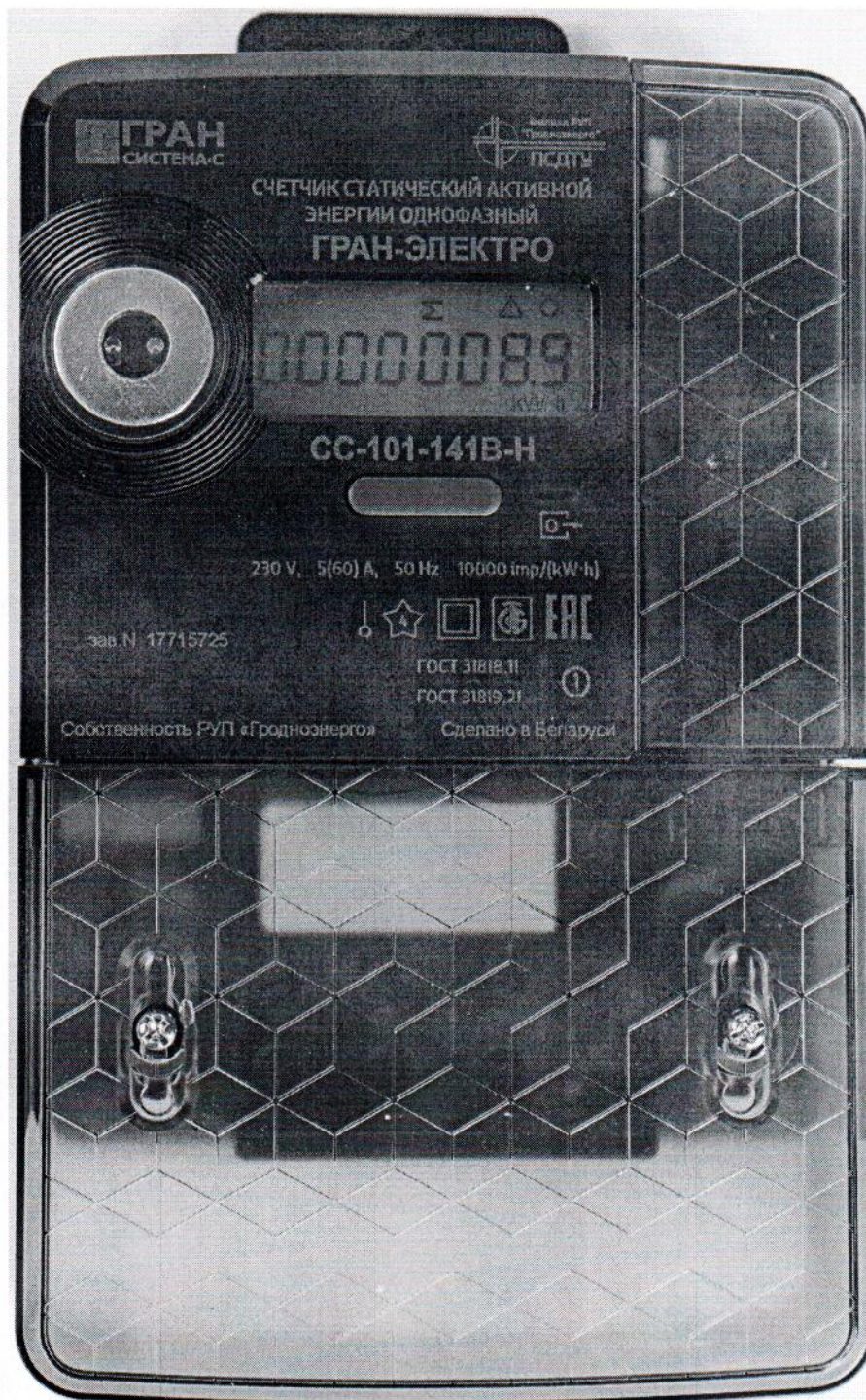
Рисунок 2. Внешний вид счетчиков «Гран-Электро СС-101».

Схема пломбирования счетчиков от несанкционированного доступа к элементам счетчика с указанием места нанесения знака поверки приведена в Приложении Б.