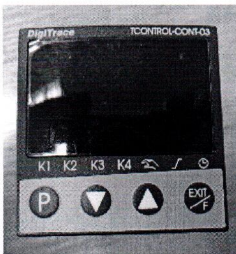
Рисунок 2 – Внешний вид исполнения TCONTROL-CONT-03