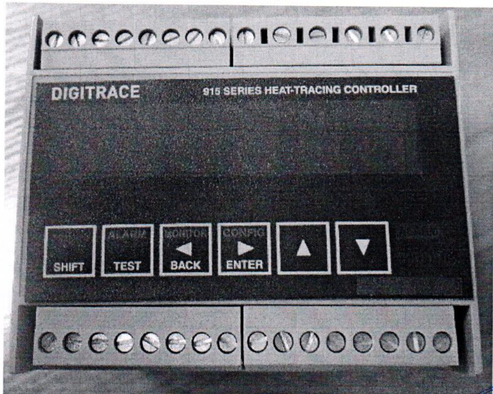
Рисунок 1 – Внешний вид исполнения HTC-915-CONT

Внешний вид приборов приведен на рисунках 1 – 3.