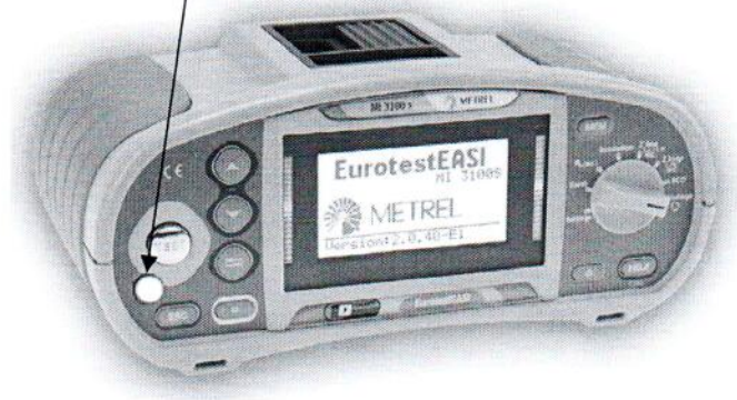
Рисунок А.1 – Место нанесения знака поверки (клейма-наклейки)

Место нанесения знака поверки (клейма-наклейки)