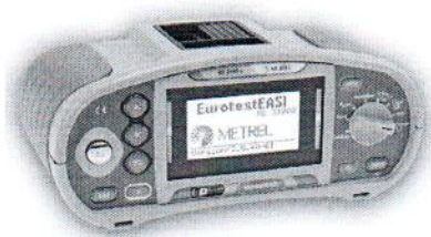
MI 3100 SE (MI 3100 s)