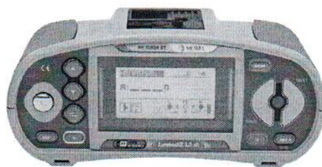
MI 3102H BT (MI 3102H SE)