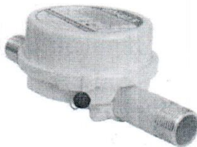
Рисунок 1 - Общий вид счетчиков