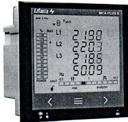
Рисунок 1 – Внешний вид анализаторов

Внешний вид анализаторов приведен на рисунке 1.