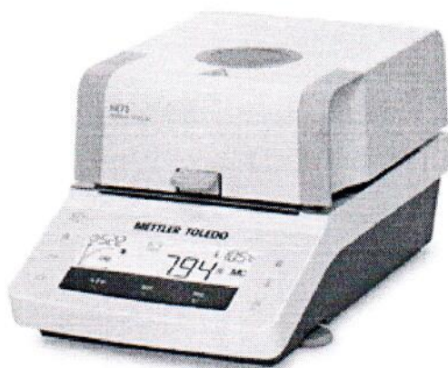
Рисунок 3 – Внешний вид анализаторов модификаций HE53, HE73