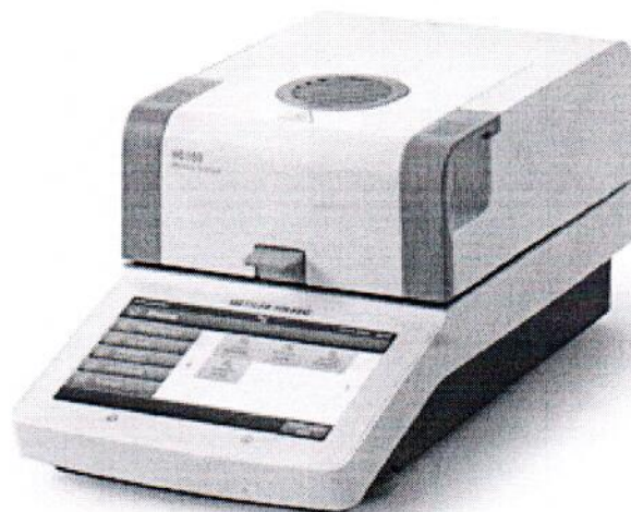
Рисунок 2 – Внешний вид анализаторов модификаций HC103