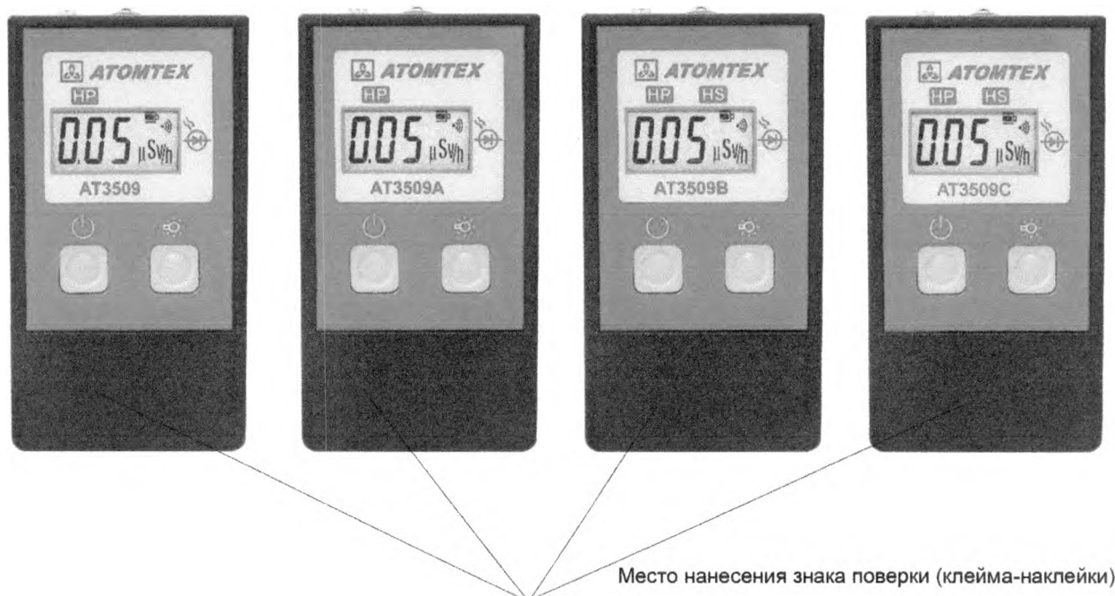
Рисунок 3 – Место нанесения знака поверки (клейма-наклейки)

Место нанесения знака поверки (клейма-наклейки) приведено на рисунке 3.