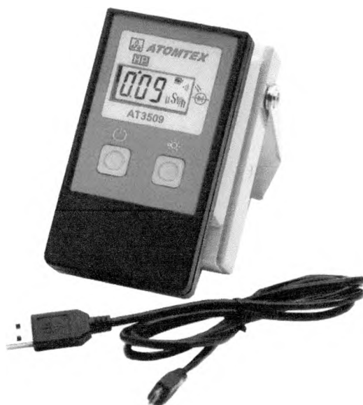
Рисунок 2 – Общий вид дозиметров совместно с устройством считывания

Общий вид дозиметров с устройством считывания приведен на рисунке 2.