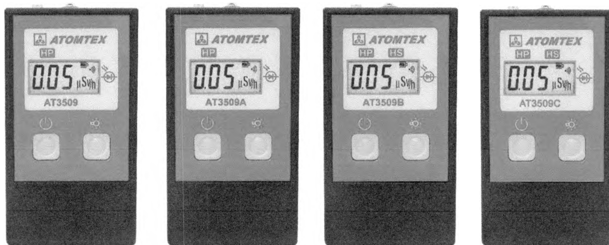
Рисунок 1 – Общий вид дозиметров

Общий вид дозиметров приведен на рисунке 1.