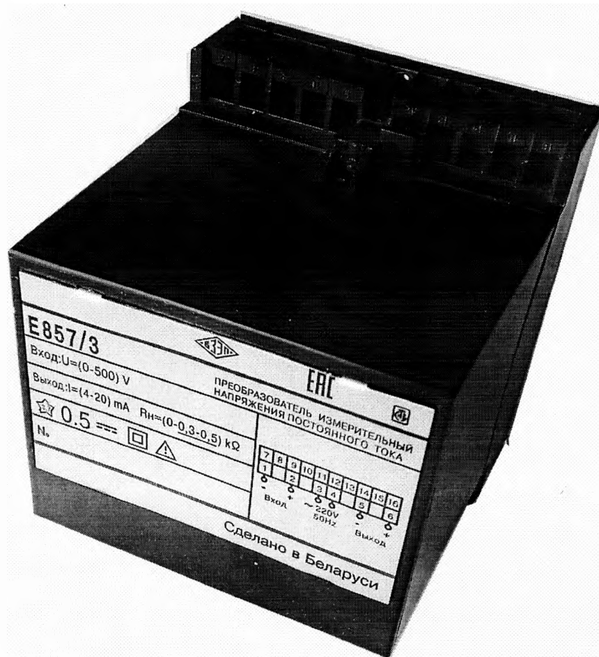
Рисунок 1.1 – Общий вид ИП

Фотографии общего вида и места для нанесения клейм приведены на рисунках 1.1 и 1.2.