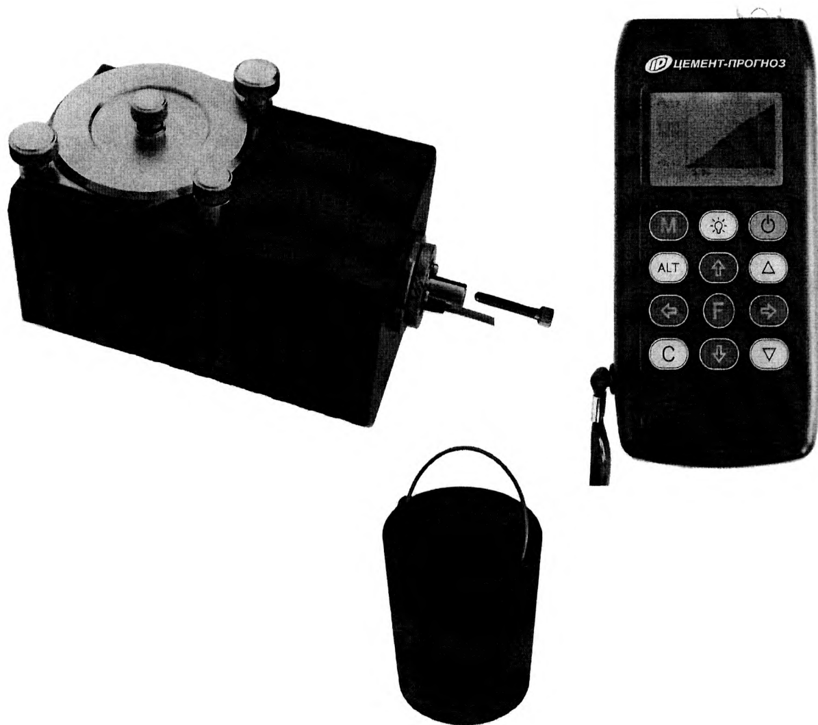
Рисунок 3— Общий вид прибора модификации ЦЕМЕНТ-ПРОГНОЗ-1