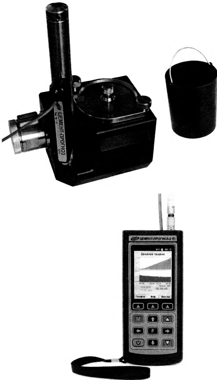
Рисунок 4 – Общий вид прибора модификации ЦЕМЕНТ-ПРОГНОЗ-2