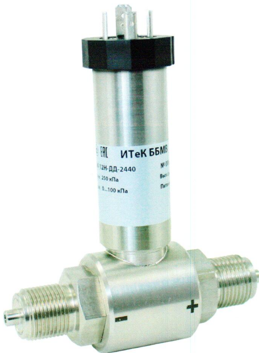
Рисунок 2. – Датчики давления ЭНИ-12Н-ДД (ЭМИС-БАРРО 10Н-ДД)