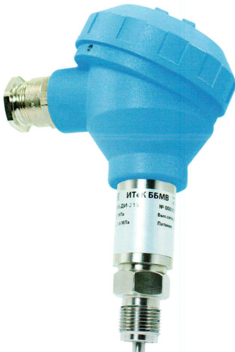
Рисунок 5. – Датчики давления: ЭНИ-12НС-ДА (ЭМИС-БАРО 10НС-ДА), ЭНИ-12НС-ДИ (ЭМИС-БАРО 10НС-ДИ), ЭНИ-12НС-ДВ (ЭМИС-БАРО 10НС-ДВ), ЭНИ-12НС-ДИВ (ЭМИС-БАРО 10НС-ДИВ)