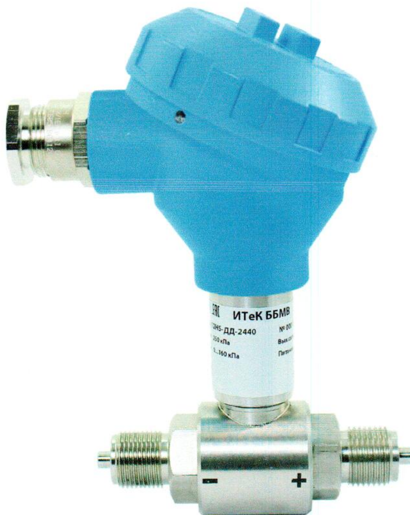
Рисунок 6. – Датчики давления ЭНИ-12НС-ДД (ЭМИС-БАРРО 10НС-ДД)