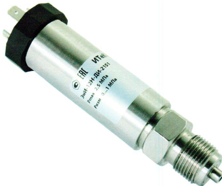
Рисунок 3 – Датчики давления: ЭНИ-12Р-ДИ (ЭМИС-БАРРО 10Р-ДИ), ЭНИ-12Р-ДИВ (ЭМИС-БАРРО 10Р-ДИВ), ЭНИ-12Р-ДВ (ЭМИС-БАРРО 10Р-ДВ), ЭНИ-12Р-ДА (ЭМИС-БАРРО 10Р-ДА), ЭНИ-12Н-ДИ (ЭМИС-БАРРО 10Н-ДИ), ЭНИ-12Н-ДИВ (ЭМИС-БАРРО 10Н-ДИВ), ЭНИ-12Н-ДВ (ЭМИС-БАРРО 10Н-ДВ), ЭНИ-12Н-ДА (ЭМИС-БАРРО 10Н-ДА).