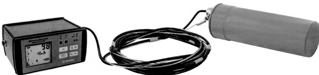
Рисунок 7 – Прибор в составе с БДКГ-01 в гермоконтейнере и БОИ