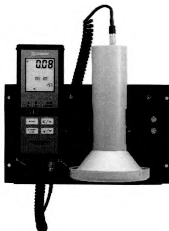
Рисунок 3 – Прибор в составе с БДПБ-02 и БОИ2 в варианте размещения на вертикальной поверхности