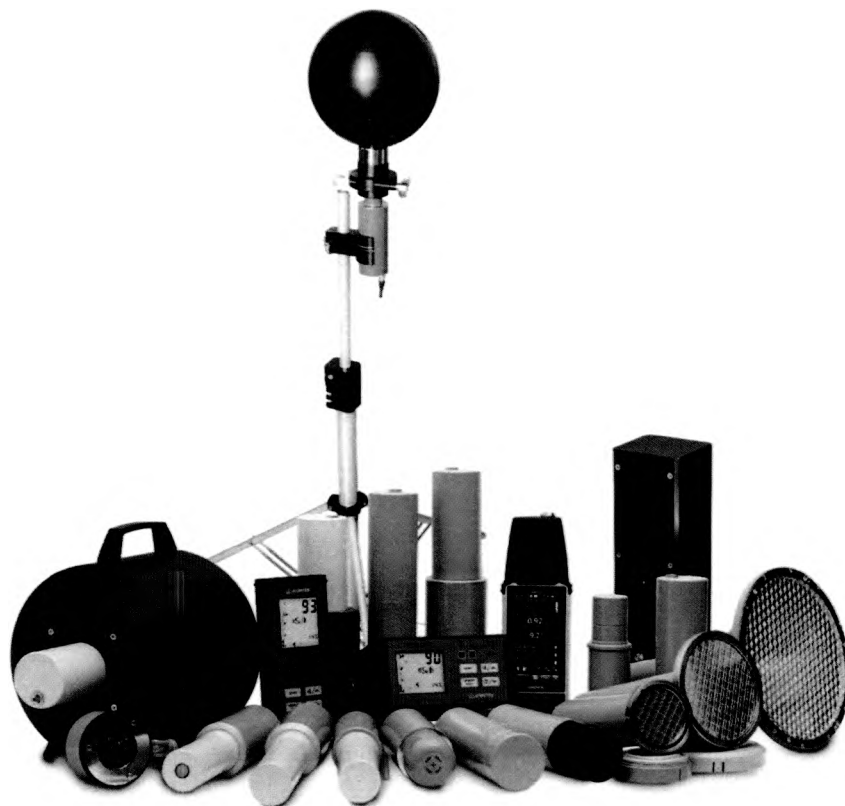
Рисунок 1 – Общий вид прибора