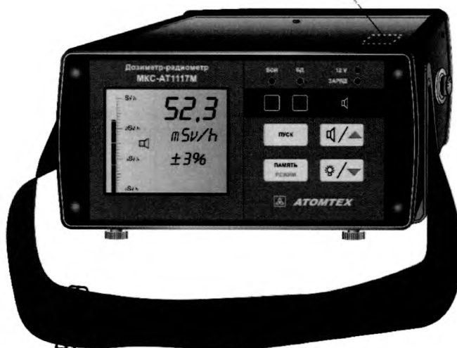
Рисунок 9 – Место нанесения знака поверки (клейма-наклейки) на БОИ

Место нанесения клейма-наклейки поверителя