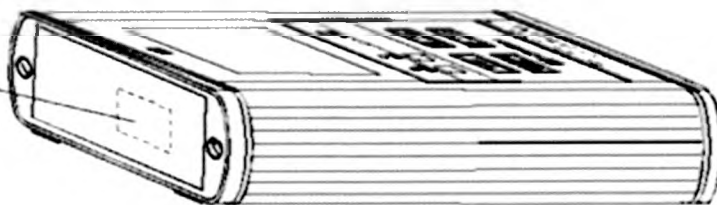
Рисунок 10 – Место нанесения знака поверки (клейма-наклейки) на БОИ2

Место нанесения клейма-наклейки поверителя