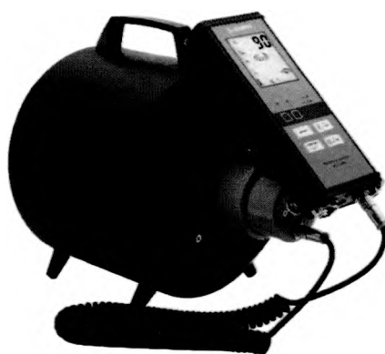
Рисунок 2 – Прибор в составе с БДКН-03 и БОИ2