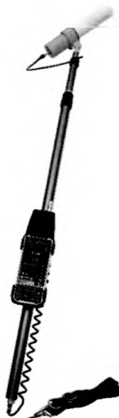
Рисунок 5 – Прибор в составе с БДКГ-01, БОИ4 на штанге