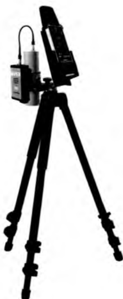
Рисунок 4 – Прибор в составе с БДКГ-30, БОИ4 и адаптером BT-DU4 на штативе