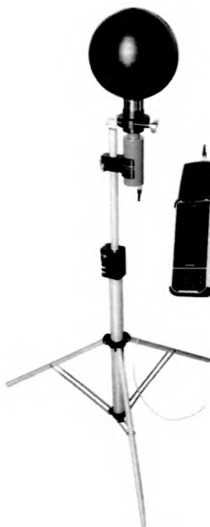
Рисунок 8 – Прибор в составе с БДКН-06

Место нанесения клейма-наклейки поверителя