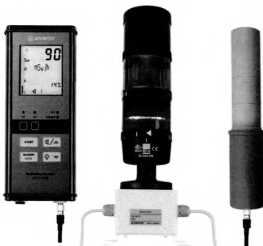
Рисунок 6 – Прибор в составе с БДКГ-01, устройством сигнализации и БОИ2