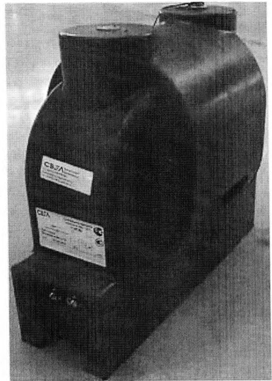
Рисунок 2 - Общий вид трансформаторов напряжения НОЛ-СВЭЛ-10М