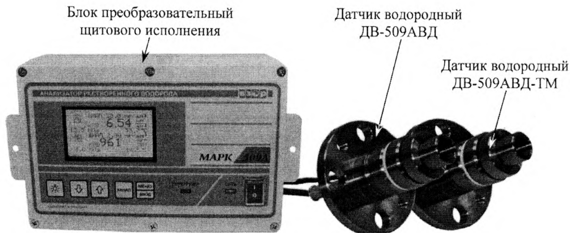
Рисунок 1 - Общий вид анализатора

Схема пломбирования от несанкционированного доступа к элементам конструкции, обозначение места нанесения знака поверки представлены на рисунке 2.