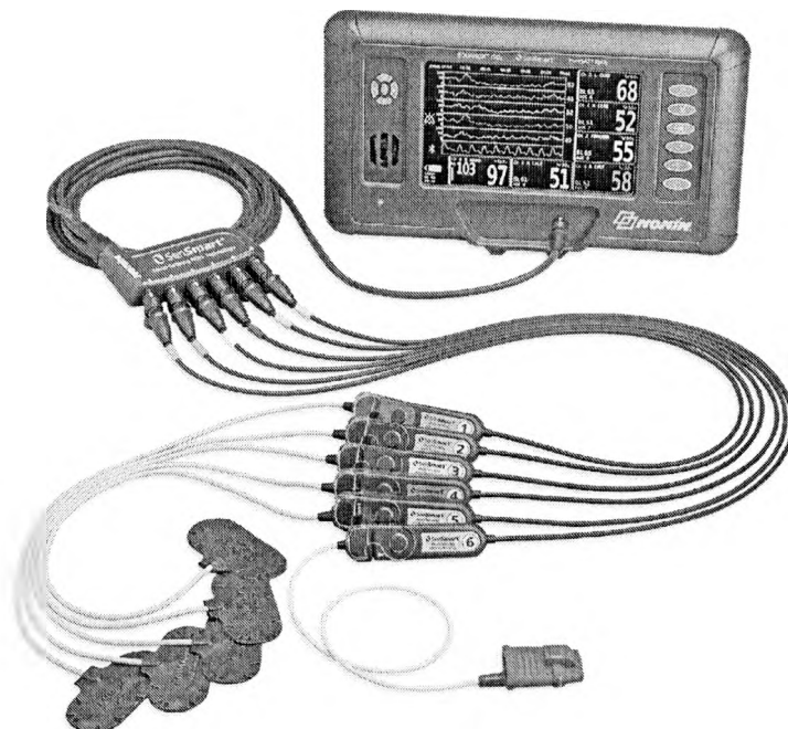
Рисунок 1 – Оксиметр универсальный SenSmart X-100

Общий вид оксиметров представлен на рисунке 1.