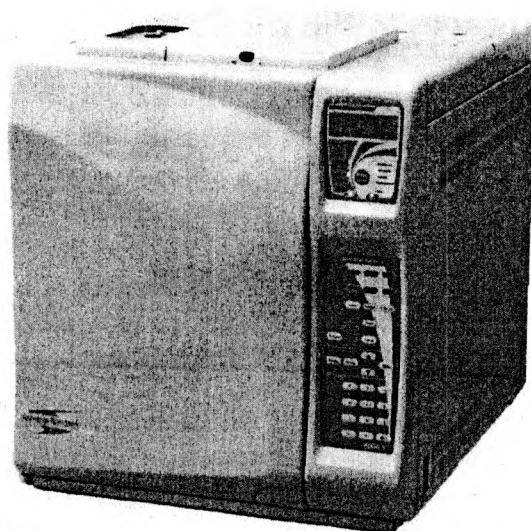
Рисунок 1 - Общий вид комплекса аппаратно-программного для медицинских исследований на базе хроматографа «Хроматэк - Кристалл 5000» - исполнение 1