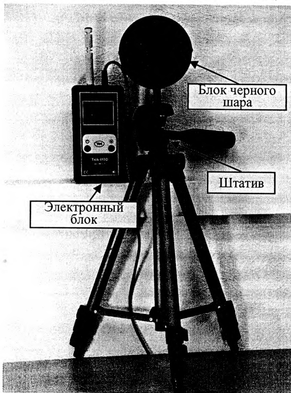
Рис. 1 Вид измерителя ТКА-ИТО

Измеритель функционирует под управлением встроенного оригинального программного обеспечения (ПО), которое является неотъемлемой частью прибора. С помощью ПО производится сбор, обработка и представление измерительной информации, а также идентификация параметров, характеризующих тип средства измерений, внесенных в программное обеспечение.