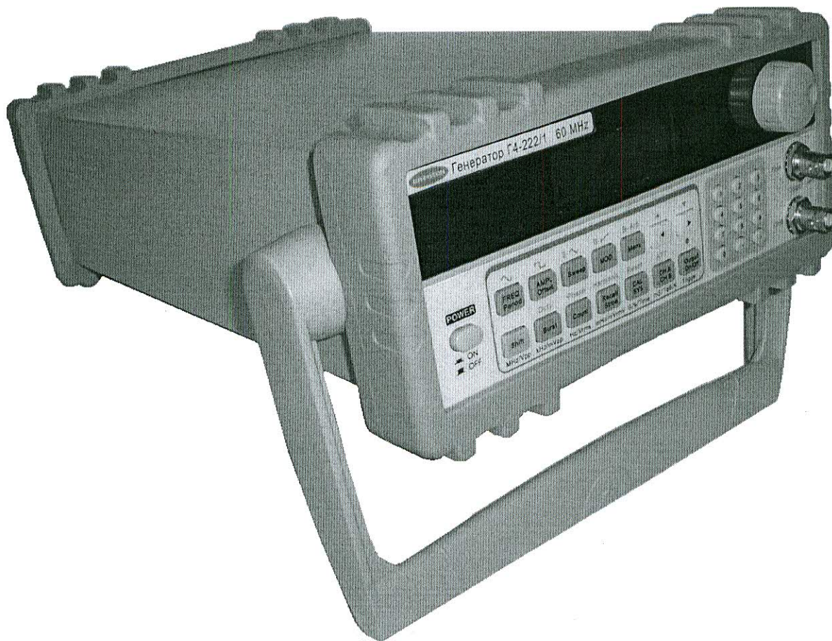
Рисунок 1 – Генератор сигналов высокочастотный Г4-222/1. Внешний вид