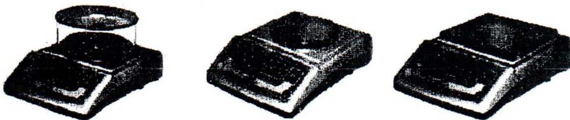
Рисунок 1 – Общий вид весов семейства 1

Весы оснащены интерфейсом, совместимым с RS232.