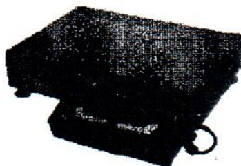
Рисунок 2 – Общий вид весов семейства 2

Для защиты весов от несанкционированной настройки и вмешательства, которые могут привести к искажению результатов измерений, весы пломбируются поверх винтов стяжки корпуса защитной наклейкой изготовителя (рисунок 3, обозначение наклейки «3»). При отклеивании разрушается изображение, нанесенное на наклейку. Отсутствие самой наклейки или разрушенное изображение надписей на наклейке свидетельствует об имевших место несанкционированных действиях.