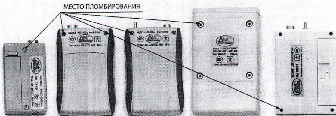
Рисунок 3 - место пломбирования мониторов Комплекта КМкн-«Союз-«ДМС»

Результаты поверки СИ удостоверяются знаком поверки, который наносится на Свидетельство о поверке.