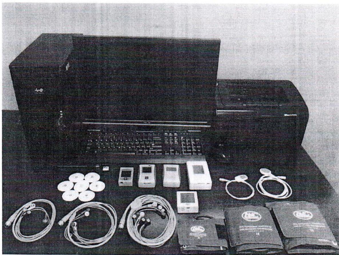
Рисунок 1 - Общий вид Комплекта КМкн-«Союз-«ДМС» с принадлежностями и расходными материалами

Общий вид Комплекта мониторов компьютеризированных носимых одно, двух, трехсуточного мониторинга ЭКГ, АД, ЧП КМкн-«Союз-«ДМС» с основными принадлежностями, место нанесения на мониторы знака утверждения типа и место пломбирования мониторов показано на Рисунках 1, 2, 3 соответственно.