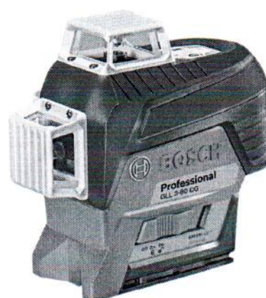
GLL 3-80CG Professional