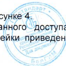
Схема пломбировки нивелира и рейки от несанкционированного доступа с указанием места расположения знака поверки в виде клейма-наклейки приведена в приложении А.

Внешний вид нивелиров приведен на рисунках 1-3, рейки – на рисунке 4.