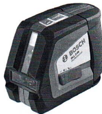
GLL 2-50 Professional