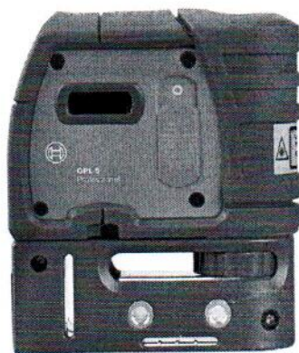
GPL 5 Professional