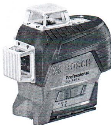
GLL 3-80C Professional