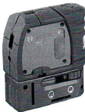
GPL 3 Professional