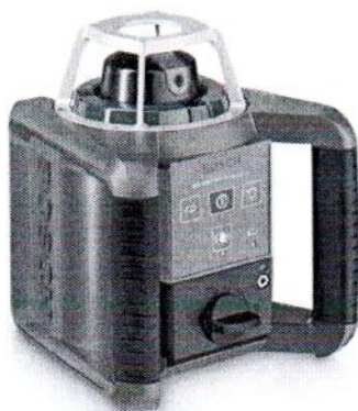
GRL 300HVG Professional