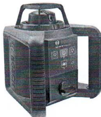
GRL 250HV Professional