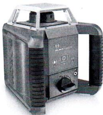
GRL 400H Professional