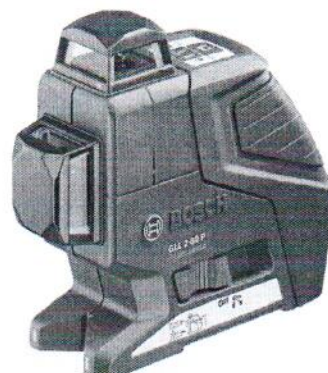
GLL 2-80P Professional