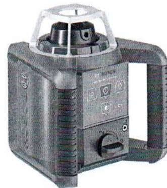
GRL 300HV Professional