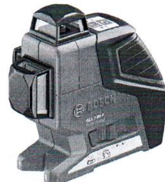
GLL 3-80P Professional