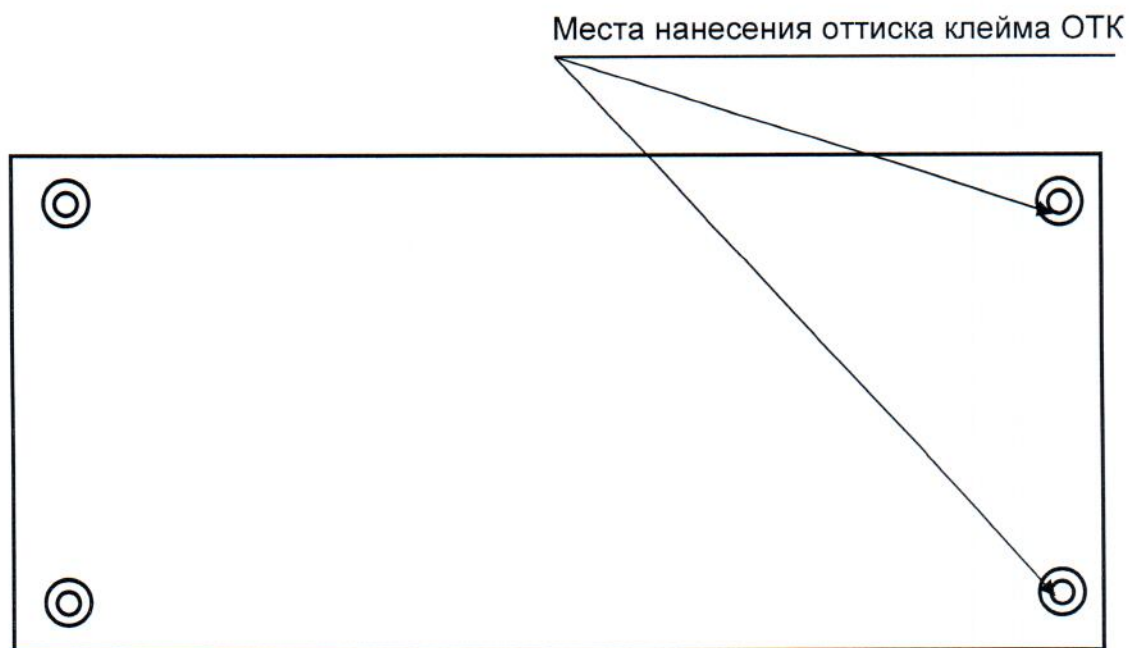
Рисунок А.2 – Нижняя панель мегаомметра