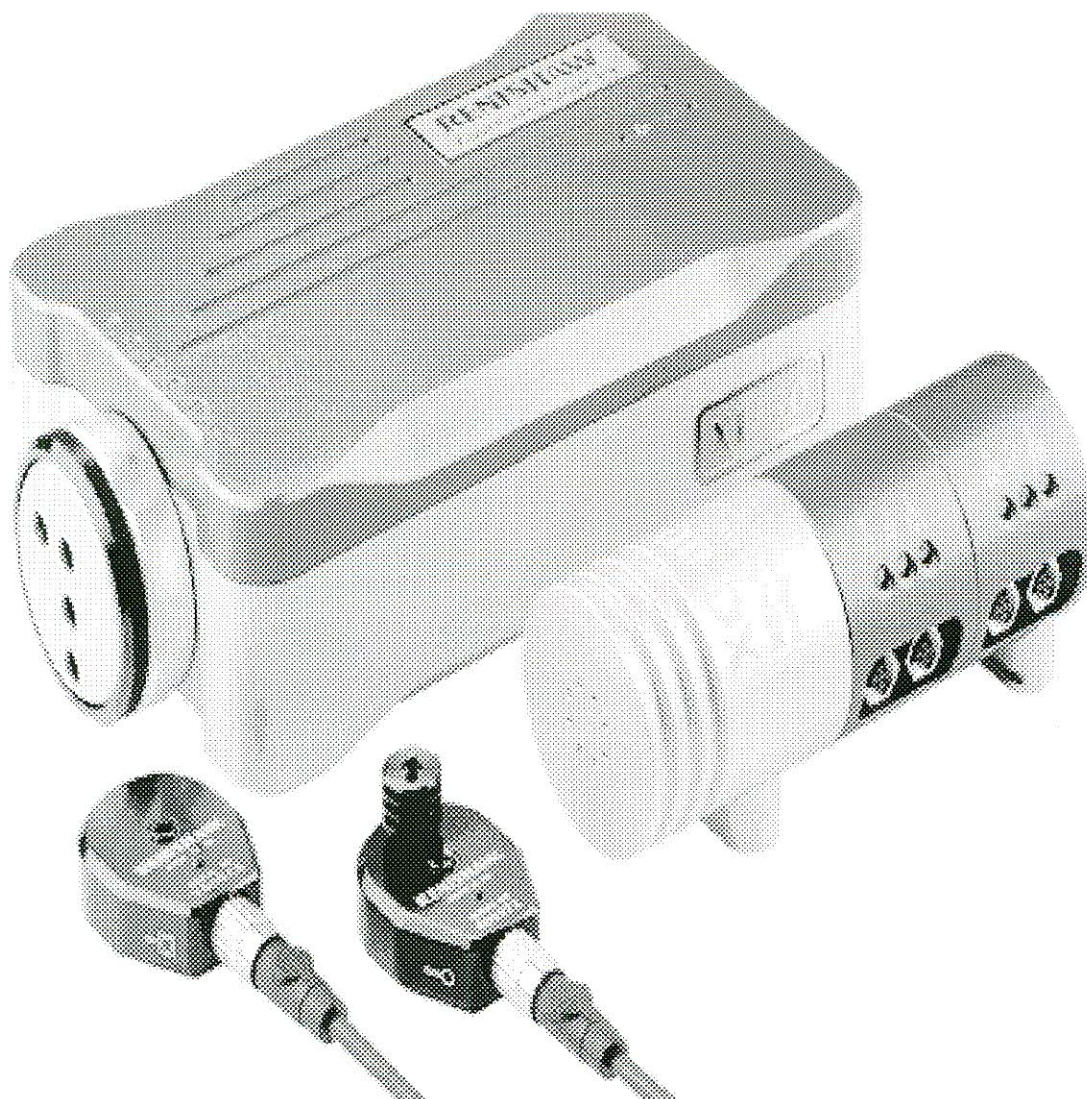
Рисунок 1 - Внешний вид лазерной интерференционной системы XL-80

Место нанесения знака поверки (клейма-наклейки) указано в Приложении 1.