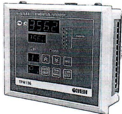
Рис.1 Общий вид приборов в корпусе «Щ4» Рис.2 Общий вид приборов в корпусе «Щ7»