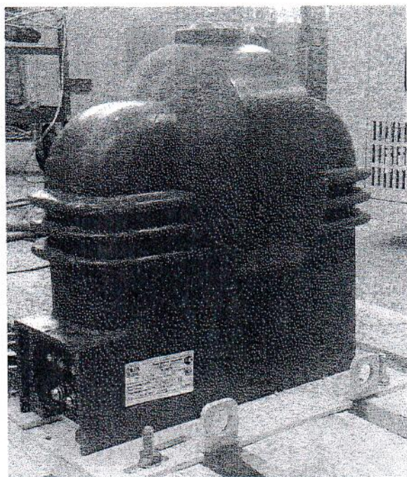
Рисунок 3 - Общий вид трансформаторов напряжения ЗНОЛ-СВЭЛ-35