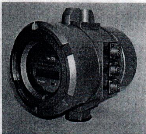
Рисунок 1 – Общий вид блока коррекции объема газа измерительно-вычислительного БК

Блоки выпускаются в двух исполнениях I и II различающихся диапазоном измерений и характеристиками погрешности по каналом измерения температуры и давления.