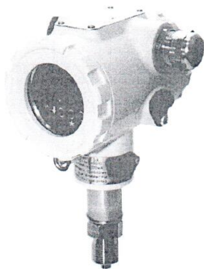
Рисунок 1 – Фото общего вида преобразователя без разделительной мембраны

Общий вид преобразователей представлен на рисунках 1-2.