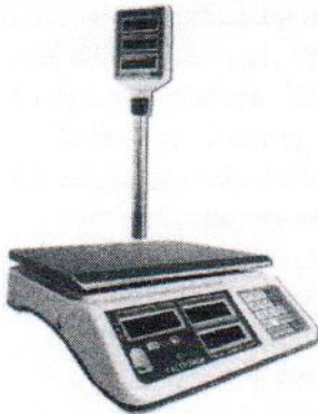
МТ 30 МГДА (5/10; 230x320)

Общий вид весов представлен на рисунке 1.