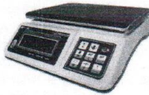
МТ 15 В1ДА (2/5; 230x320)