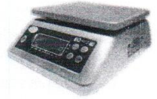
МТ 6 В1ДА (2; 225x185, нерж.)