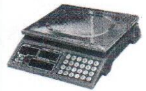
МТ 30 МДА (5/10; 230x300)