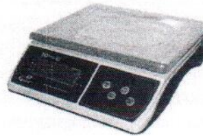
МТ 15 В1ЖА (2/5; 230x300)