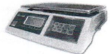
МТ 30 ВЖА (5/10; 230x330)