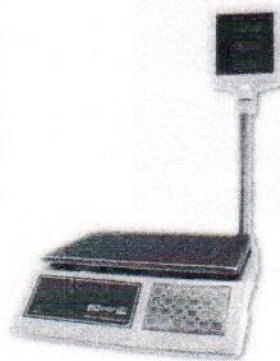
МТ 15 МГЖА (2/5; 230x330)