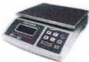
МТ 6 ВДА (1/2; 220x270)