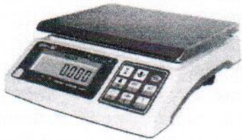
МТ 6 ВДА (1/2; 230x290)