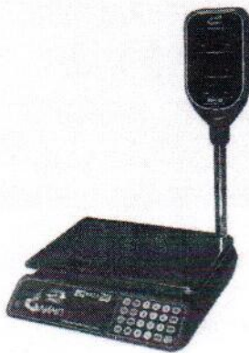
МТ 30 МГДА (5/10; 230x330)