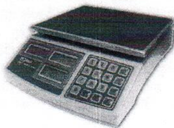
МТ 15 МЖА (2/5; 220x270)