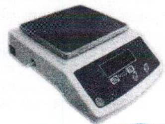
МТ 3 В1ДА (0,5/1; 225x145)