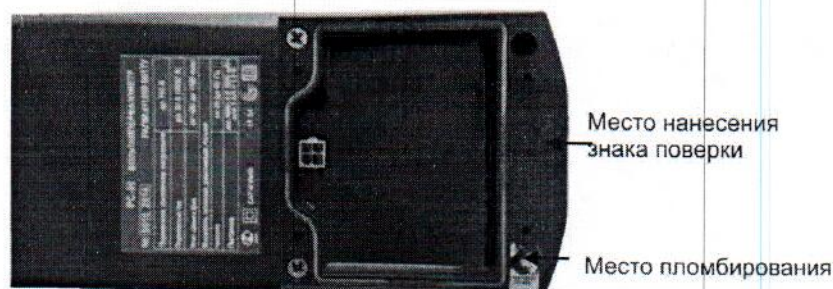
Рисунок 2 – Схема пломбирования