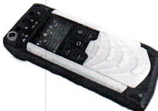
Рисунок 1 – Общий вид вольтамперфазометров РС-30

Несанкционированный доступ внутрь приборов предотвращается пломбированием винта крепления под крышкой аккумуляторного отсека. Схема пломбирования приведена на рисунке 2.