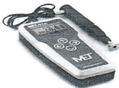
Рисунок 3 – Внешний вид твердомера MET-U1A