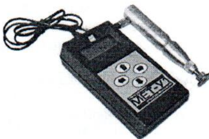
Рисунок 1 – Внешний вид твердомера МЕТ-У1

Внешний вид твердомера МЕТ-У1 приведен на рисунке 1, схема пломбировки от несанкционированного доступа на рисунке 2.