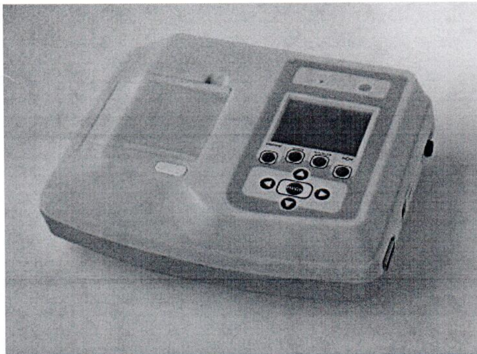
Рисунок 1- Электрокардиограф одно/трехканальный ЭК1Т-1/3-07 "АКСИОН"