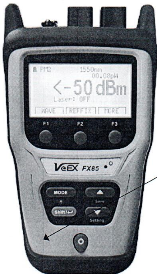
Схема с указанием мест нанесения знака поверки

Место нанесения знака поверки в виде клейма-наклейки