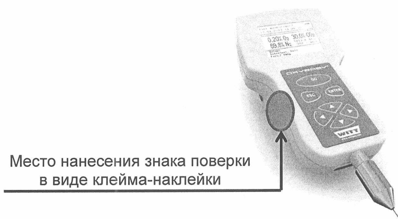
Рисунок А.1 - Схема пломбировки газоанализаторов

Схема пломбировки газоанализаторов от несанкционированного доступа с указанием места нанесения знака поверки в виде клейма-наклейки приведена на рисунке А.1.