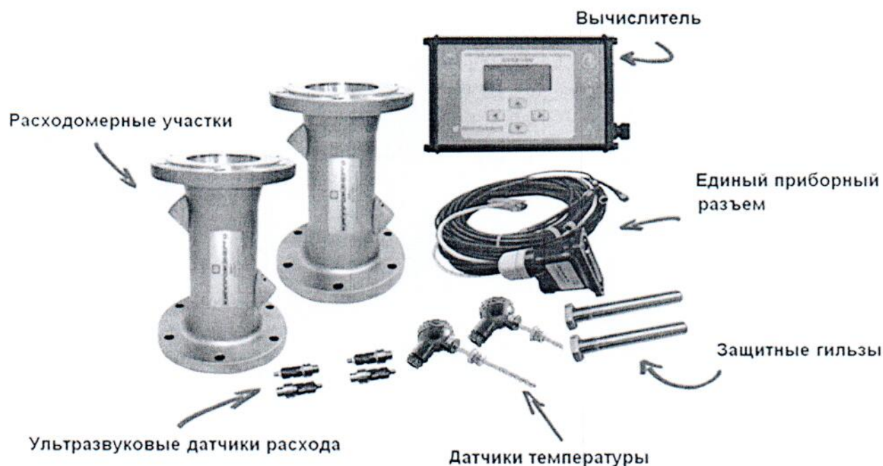
Рисунок 1 – Внешний вид составных частей счетчиков

Внешний вид составных частей счетчиков приведен на Рисунке 1.